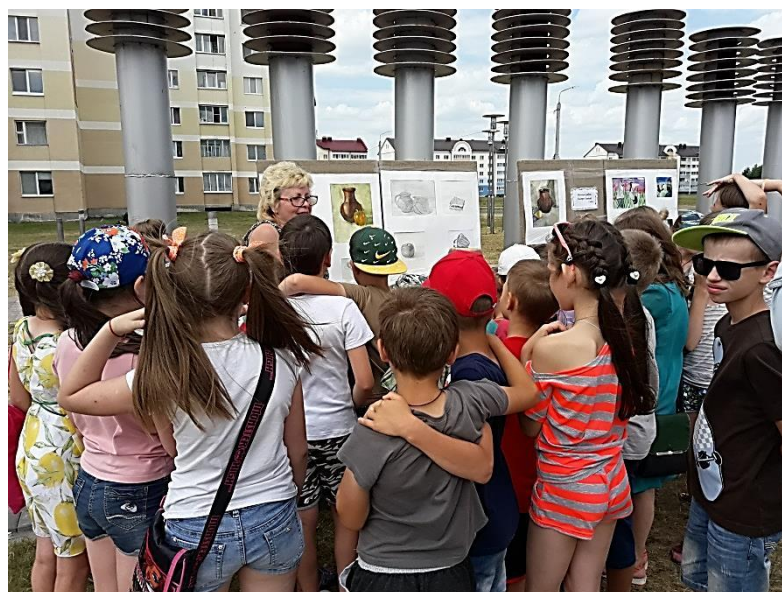
7.4. «Let's pull literary turnip», theatrical game program (Semenovichi Rural Library, Semenovichi Rural House of Culture)